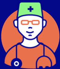
Huisarts / POH

"Ik wil meedoen aan activiteiten, maar ik weet niet waar ik moet beginnen. Ik zie door de bomen het bos niet meer."